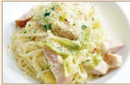
ベーコンとキャベツの ペペロンチーノ ~香草パン粉かけ~

Spaghetti Peperoncino : Bacon, Cabbage, Bread Crumb with Herb