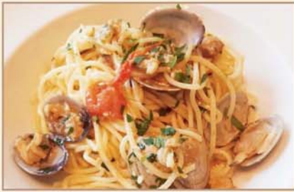
石川県産トマトとアサリの ボンゴレビアンコ スパゲッティ