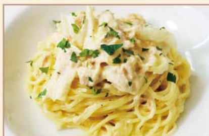
ツナとキャベツの クリームソース スパゲティ