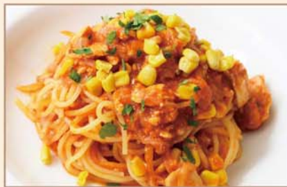
サーモンととうもろこしの トマトソース スパゲティ