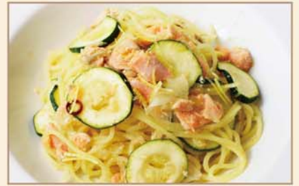
サーモンとズッキーニの ペペロンチーノ ~レモン風味~

Spaghetti Peperoncino : Bacon, Cabbage, Bread Crumb with Herb