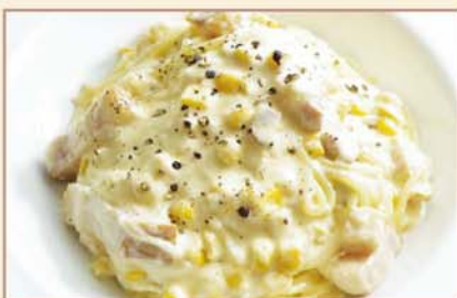
トウモロコシとベーコンの カルボナーラ スパゲッティ