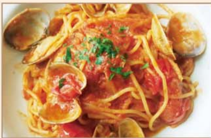
石川県産トマトとアサリの ボンゴレロッソ スパゲッティ