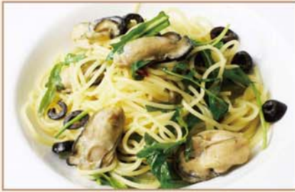
カキとオリーブ、ケッパーの ペペロンチーノ スパゲティ

Spaghetti peperoncino : Oyster, Olive, Capers