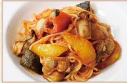
カキと夏野菜の トマトソース スパゲティ

Spaghetti peperoncino : Oyster, Olive, Capers