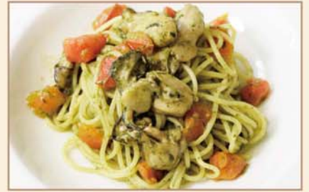
カキとフレッシュトマトの ジェノベーゼ スパゲティ

Spaghetti : Oyster, Summer vegetables, Tomato sauce