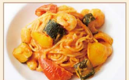
海老と夏野菜のトマトクリームソース スパゲティ

Spaghetti : Shrimp, Summer vegetables, Tomato cream sauce